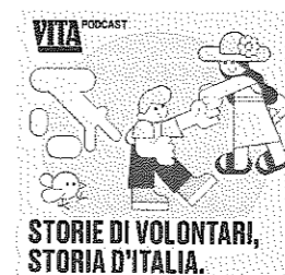
STORIE DI VOLONTARI, STORIA D'ITALIA.