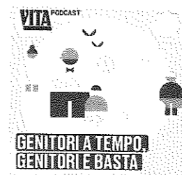
GENITORI A TEMPO, GENITORIE BASTA.