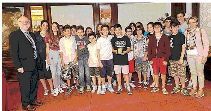
Gli alunni dell'istituto Sant'Alberto Magno