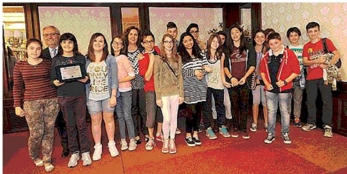
Sempre sul secondo gradino del podio, la scuola media Marconi di Casalecchio