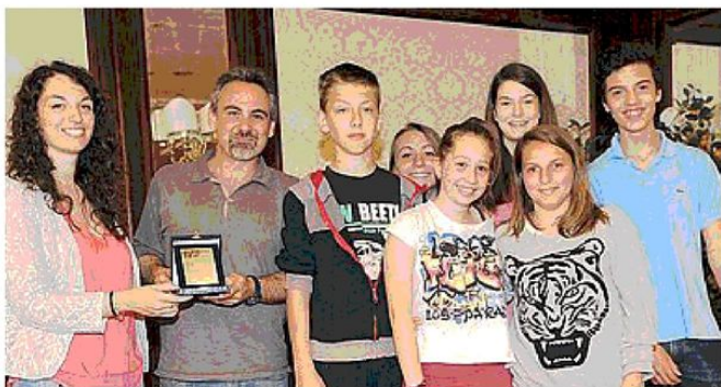
TARGA RICORDO Una rappresentanza degli alunni della scuola media Panzini