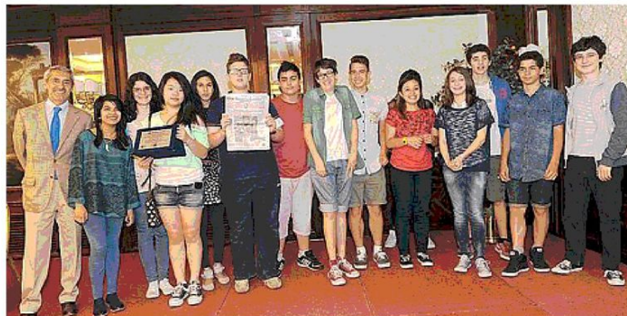
Terzi classificati, i giovani cronisti delle scuole medie Testoni-Fioravanti