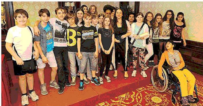
I ragazzi della scuola media Zanotti, vincitori del premio Multimedia Extra