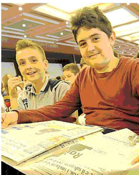
INFORMARSI È BELLO Qui a fianco un promettente giornalista in erba di Sasso Marconi legge il giornale