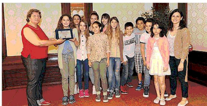
Al secondo posto, parimerito, l'istituto San Luigi. Ecco la sua redazione