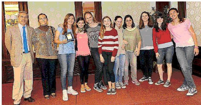
La redazione in rosa della scuola media Cerreta che ha conquistato i click dei lettori