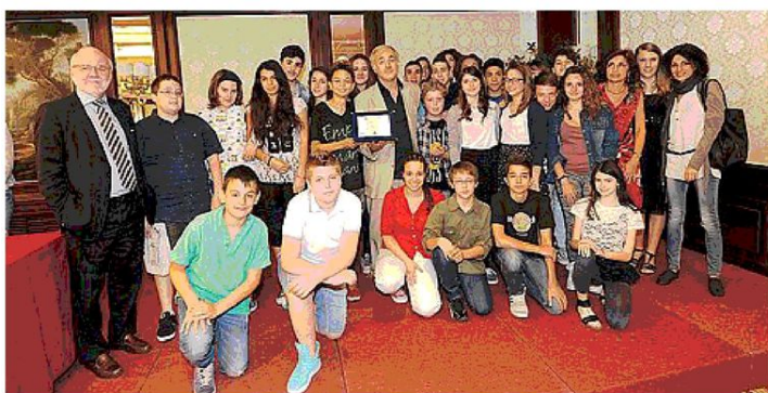
PODIO I primi classificati, i ragazzi della scuola media Nicholas Green di Argelato

FOTO, AUDIO E VIDEO A CORREDO DEGLI ARTICOLI PUBBLICATI SU CARTA: I VINCITORI DELLA NUOVA SEZIONE SONO I RAGAZZI DELLE MEDIE ZANOTTI